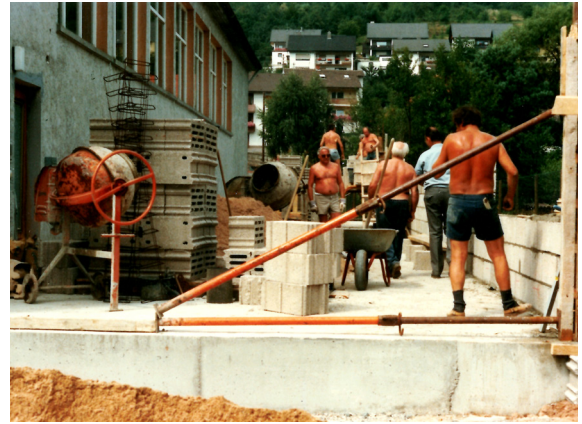
Fleißige Helfer packen beim Anbau mit an.