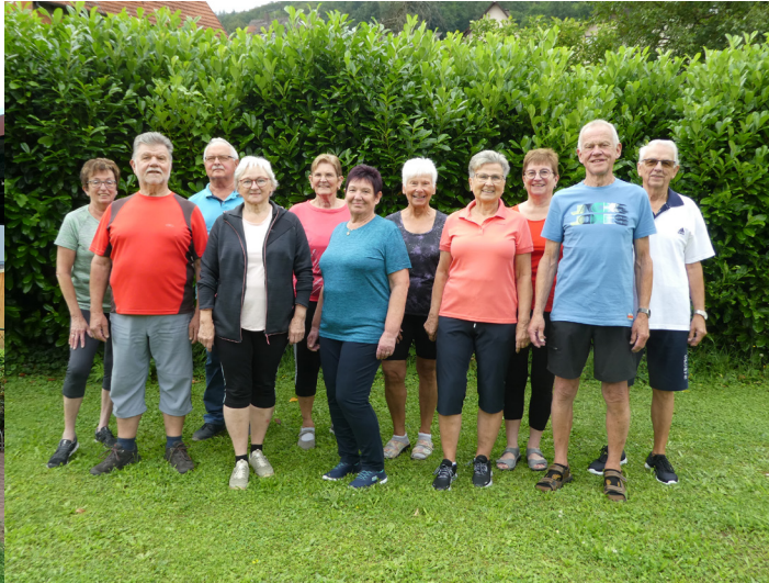
Fit ab 50