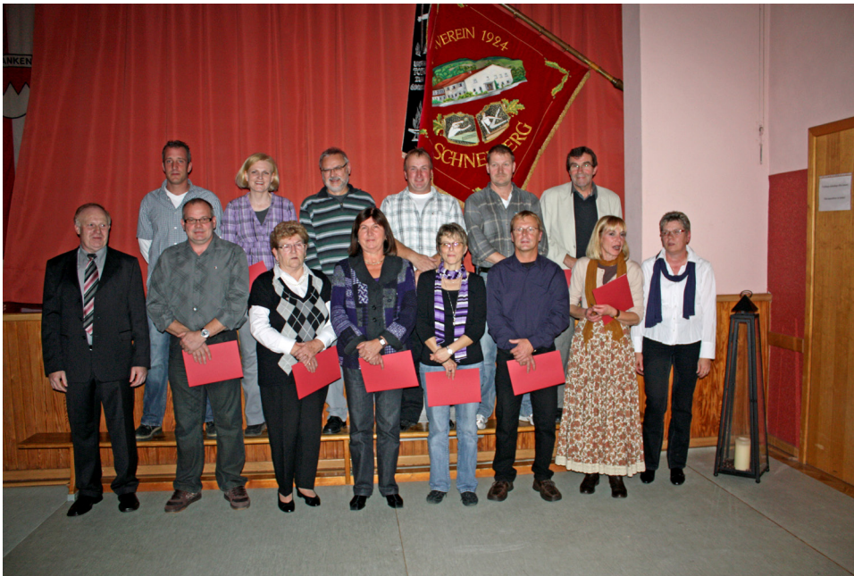
Ehrung für 25-jährige Mitgliedschaft