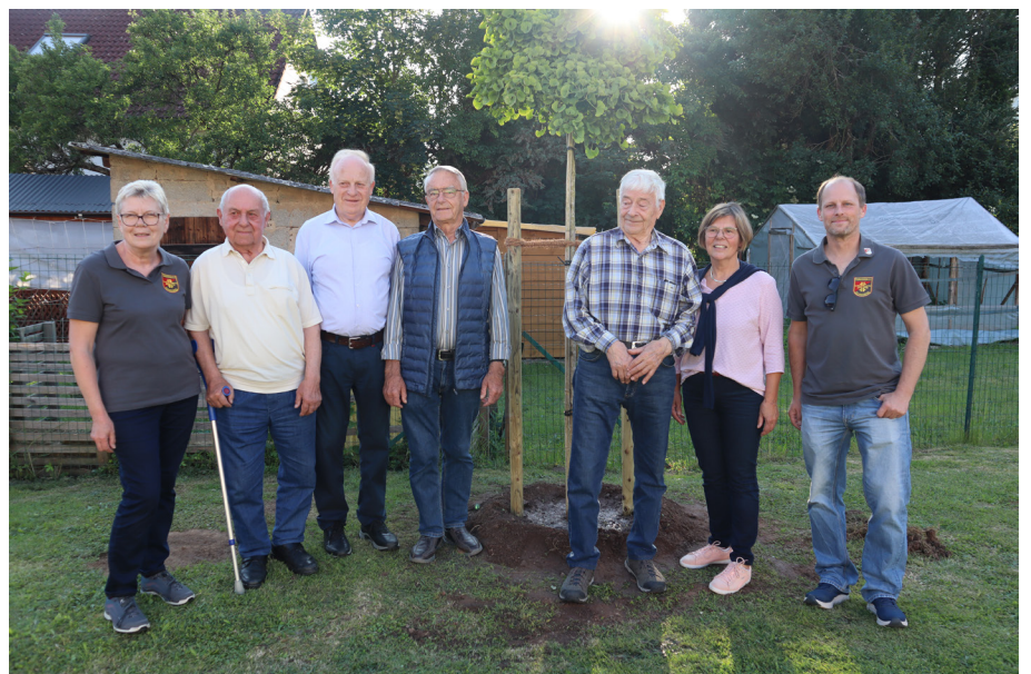
Beim Pflanzen unseres Ginkgobaums am 04. Juni 2024