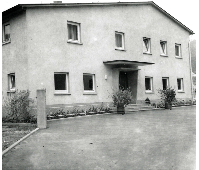
Einweihung der Turnhalle am 06. November 1965