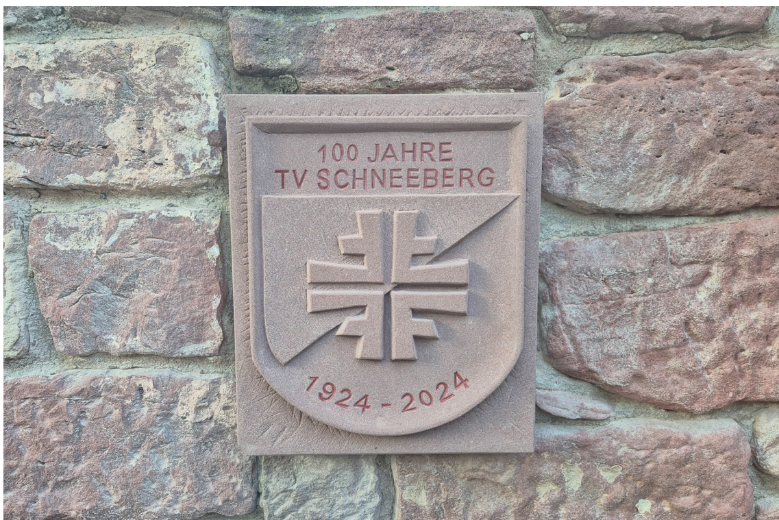
Der Gedenkstein am Parkplatz in der Hauptstraße erinnert daran, dass hier vor 100 Jahren im ehemaligen Gasthaus „Zum Hirschen“ der Turnverein gegründet wurde.