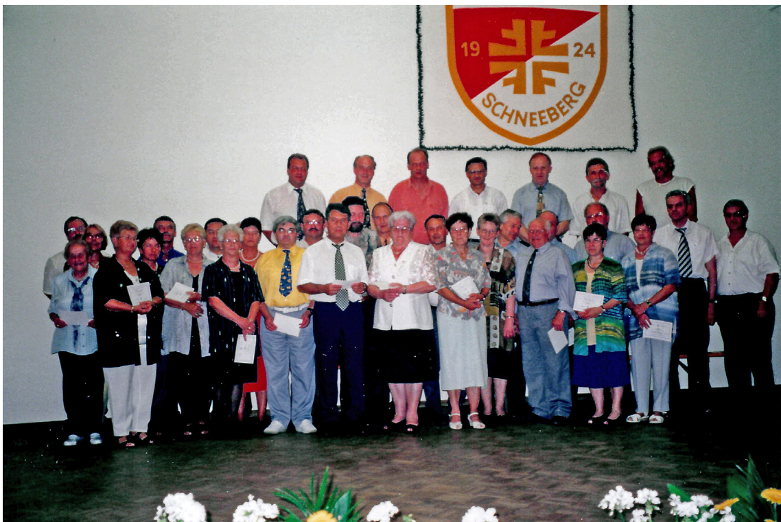
Ehrung für 25-jährige Mitgliedschaft