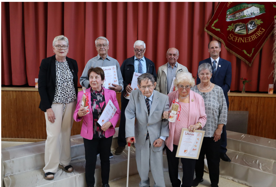
An unserem Ehrenabend am 25. Mai 2024