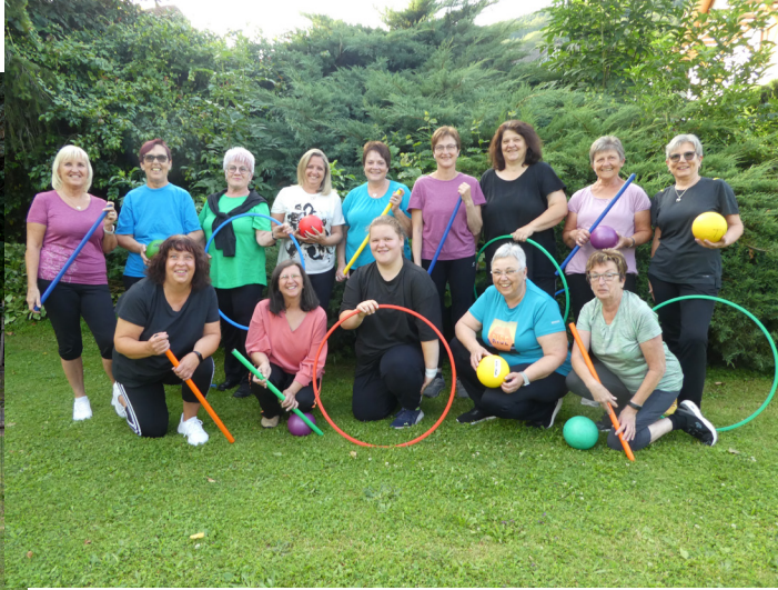
Gymnastikgruppe am Montag