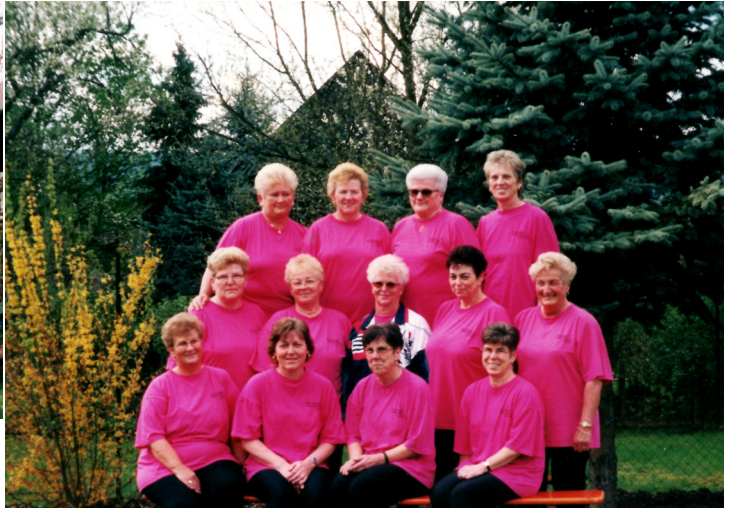
Gymnastikgruppe am Mittwoch