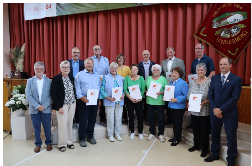
Ehrung für 50-jährige Mitgliedschaft