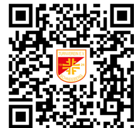
Video der Verleihung