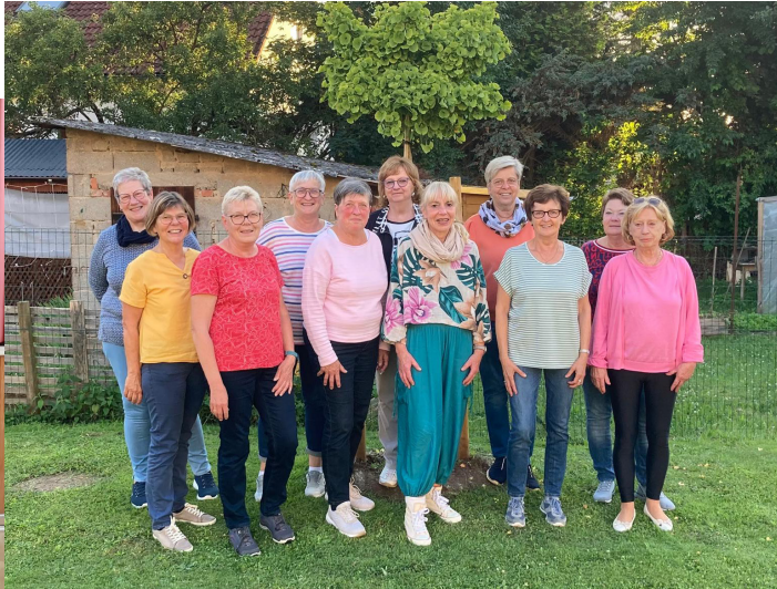
Gymnastikgruppe am Donnerstag