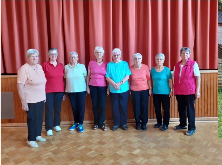
Gymnastikgruppe am Mittwoch