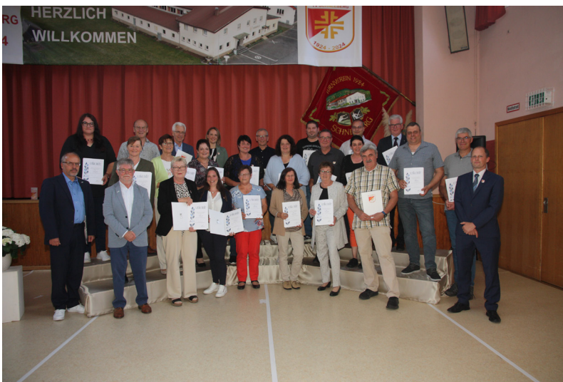
Ehrung für 25-jährige Mitgliedschaft