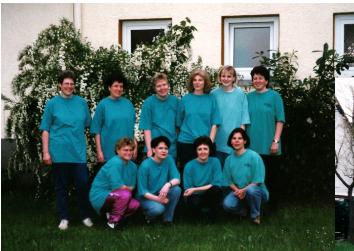
Gymnastikgruppe am Donnerstag