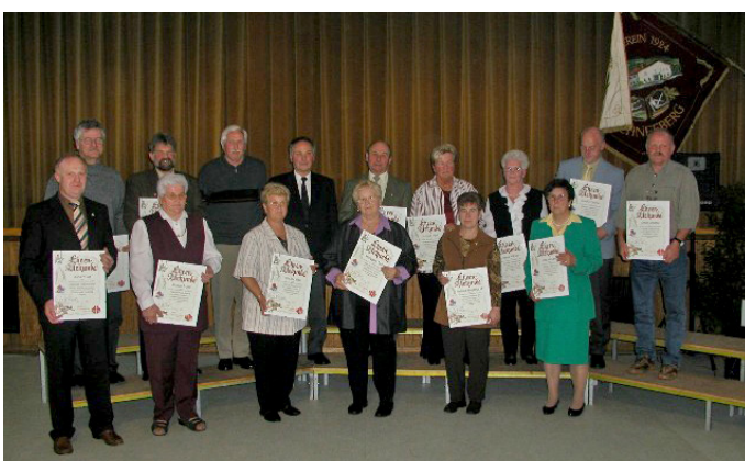
Ehrung für 40-jährige Mitgliedschaft