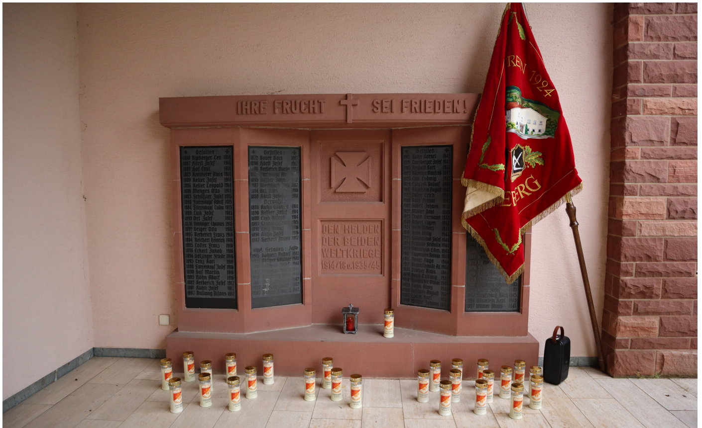
Beim Friedhofsgang gedachten wir unserer verstorbenen Ehrenmitglieder und Mitglieder.