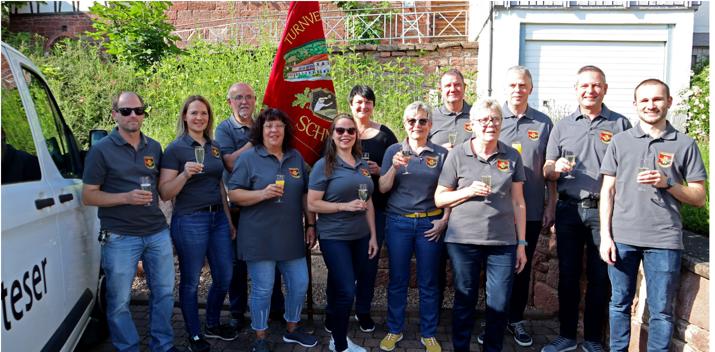
Am Parkplatz in der Hauptstraße, dem ehemaligen Standort der Gaststätte „Zum Hirschen“ und Gründungs-ort des Vereins, haben wir mit einem Glas Sekt auf das Jubiläum angestoßen.

Als Symbol für Langlebigkeit und Hoffnung auf eine erfolgreiche Zukunft des Vereins pflanzten wir einen Ginkgobaum auf unserem Außengelände.