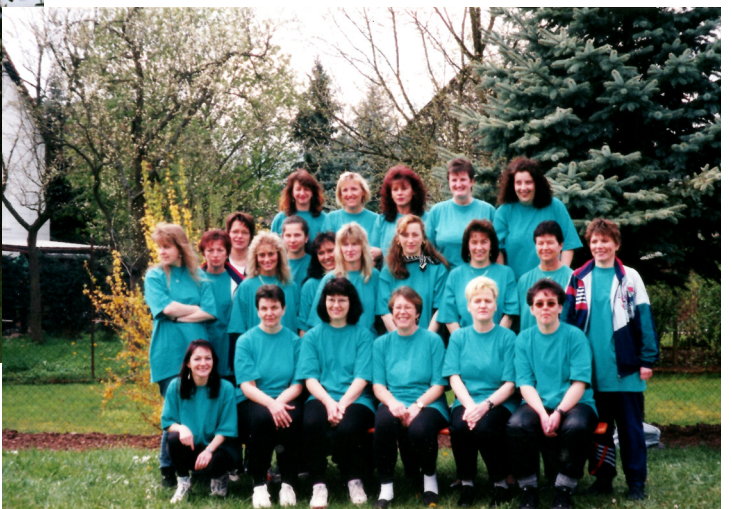
Gymnastikgruppe am Montag